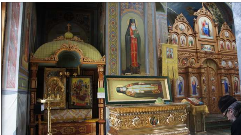
Svaté ostatky vyznavače Alexije ve Svato-nikolském monastýru v obci Iza